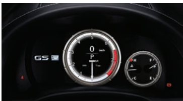
PANEL DE INSTRUMENTOS DISEÑO F-SPORT