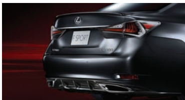
SPOILER Y PARAGOLPES TRASERO F-SPORT