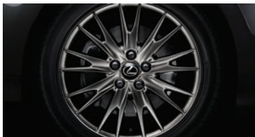
LLANTAS DE ALEACIÓN OSCURECIDAS