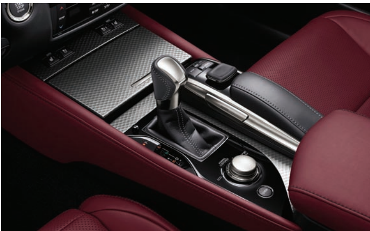
ASIENTOS TAPIZADOS EN CUERO PERFORADO