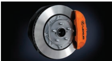
CALIPER DE FRENOS F-SPORT